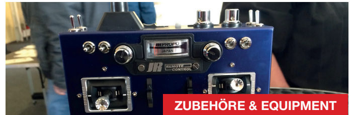
ZUBEHÖRE & EQUIPMENT

Traditionsgemäß ist die ROTOR Live auch die Plattform, auf der die meisten Neuheiten für die kommende Flugsaison präsentiert werden. Das Angebot der vorgestellten RC-Helis reicht dabei von 3D-Modellen bis hin zu beeindruckenden vorbildgetreuen Scale-Helikoptern in allen erdenklichen Größen. Hier haben die Besucher direkt vor Ort die Möglichkeit, sich bei Konstrukteuren und Herstellern über die teils hochkomplexe Technikboliden zu informieren.